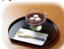
白玉ぜんざい 400円(税込)

★白玉ぜんざいは、今月まで。 12月からは、おしるこを販売します。 冷たいぜんざいは、しばらくお休みします。