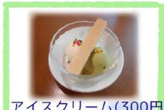
アイスクリーム(300円)

★アイスクリームがリニューアル！ バニラアイスクリームにくわえて、 抹茶アイスクリームも お選びいただけるようになりました。