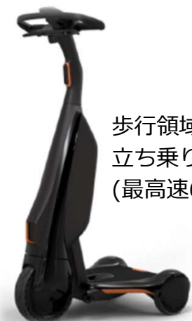
歩行領域 立ち乗りEV (最高速6Km)