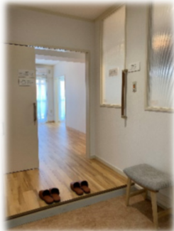
モデル住宅の広い玄関