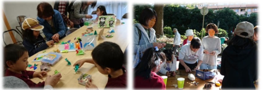
11/17 多世代交流イベントの様子