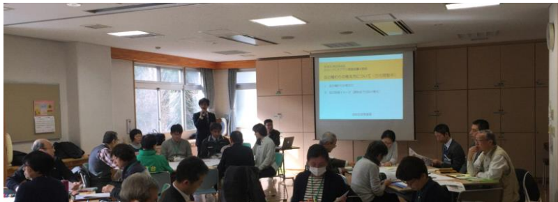
旭区区政推進課より概要説明(22名参加)

みらいづくりプラン基本方針のうち、テーマA「地域包括子育て」とテーマB「安全・安心・健康まちづくり」の2つにテーマを絞り、全部で4グループに分かれてグループワークを行ないました。